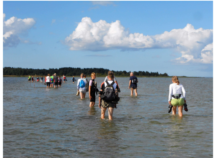
Retk Kaevatsi laiule